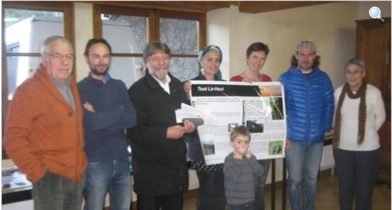
L'association propose de nombreuses animations sur le territoire.

Publié le 17/12/2015 à 03:54, Mis à jour le 17/12/2015 à 08:15